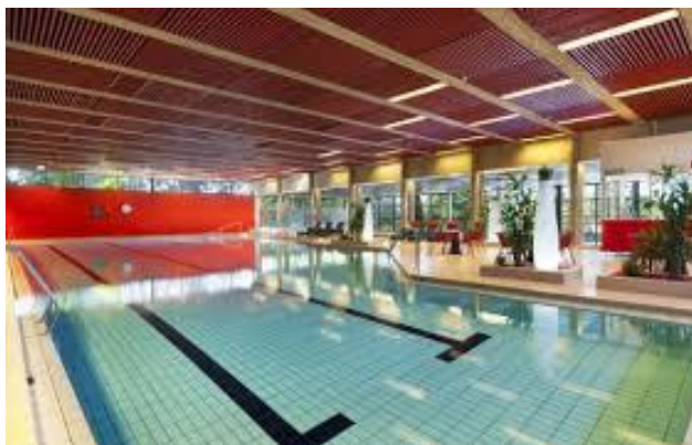
Scandic Hotel Sjundeå

För att lyfta fram brandkårsverksamheten önskar vi, att ni kommer i någon form av brandkårskläder: stationskläder, T-skjorta, uniform, uniform utan medaljer, m.m.